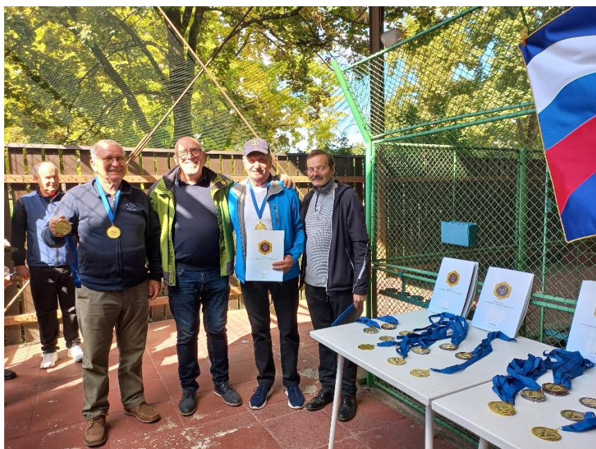
Streljanje z zračno puško

Vsi so ponosno zastopali svoj klub in dosegli odlične rezultate. Tako so člani mariborskega kluba s svojo vztrajnostjo in športnim duhom tudi letos ponovno dokazali, da sodijo v sam vrh slovenskih klubov.