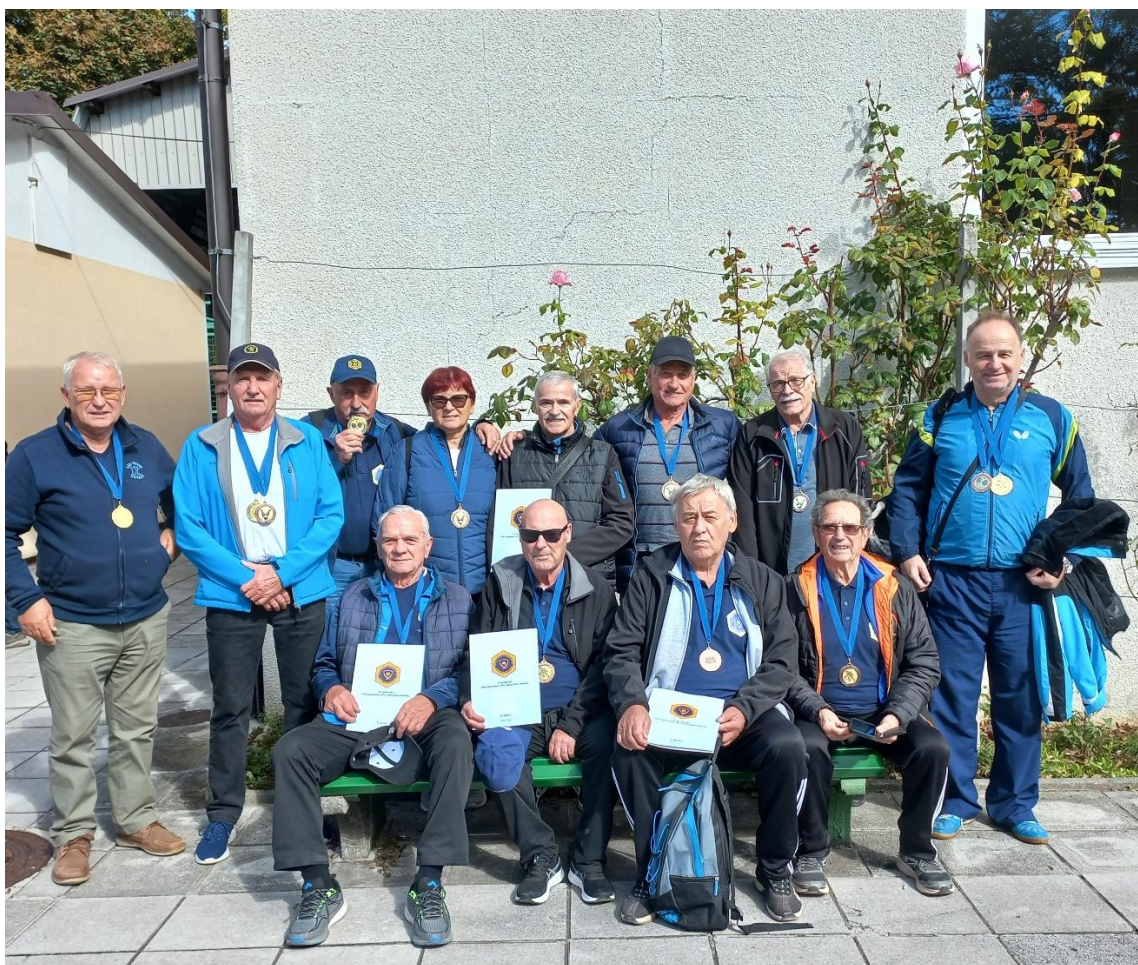
Športnica in športniki mariborskega kluba

Čeprav smo podelili tudi priznanja in medalje, pa je bilo v ospredju še vedno predvsem druženje. Dobitnikom priznanj in medalj je izrekel iskrene čestitke, vsem udeležencem iger pa se je zahvalil za sodelovanje.