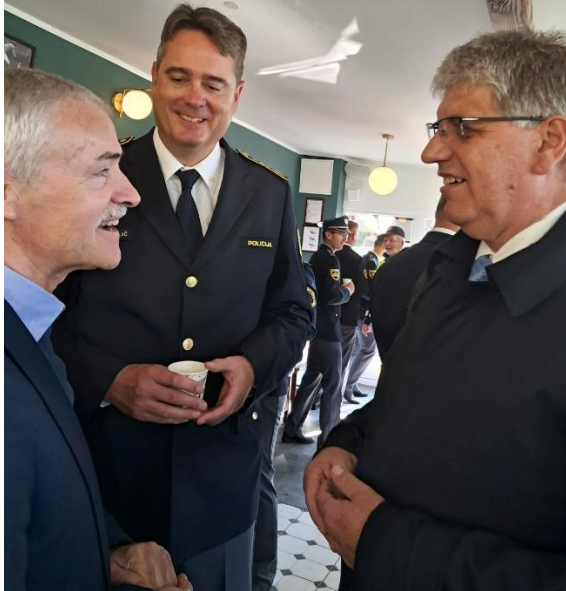
V družbi z direktorjem PU in ministrom