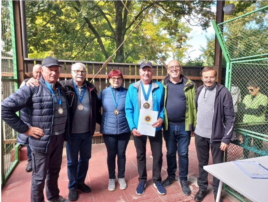
Ekipa, ki je tekmovala v kegljanju