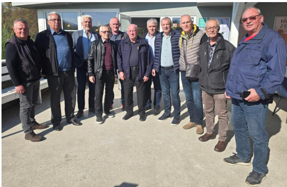
Upokojeni policisti-konjeniki so tudi člani našega kluba

Policijska uprava Maribor je v Kamnici, 17. oktobra 2025, pripravila slovesnost ob 40-letnici delovanja konjeniške policije. Slavnostna govorka je bila predsednica Državnega zbora RS mag. Urška Klakočar Zupančič.