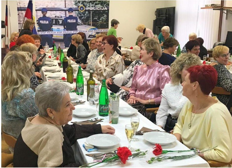
Uradni del prireditve smo nadaljevali s pogostitvijo. Poleg kosila smo jih počastili še s kosom torte in penino.