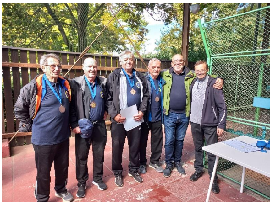
Ekipa, ki je tekmovala v balinanju

Zmagovalci so za svoj dosežek prejeli priznanja in medalje, kar jim bo zagotovo ostalo v lepem spominu.